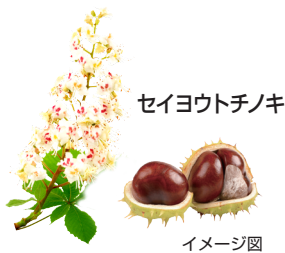
セイヨウトチノキ